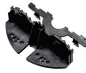
Držalo za letve