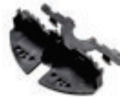
Držalo za letve